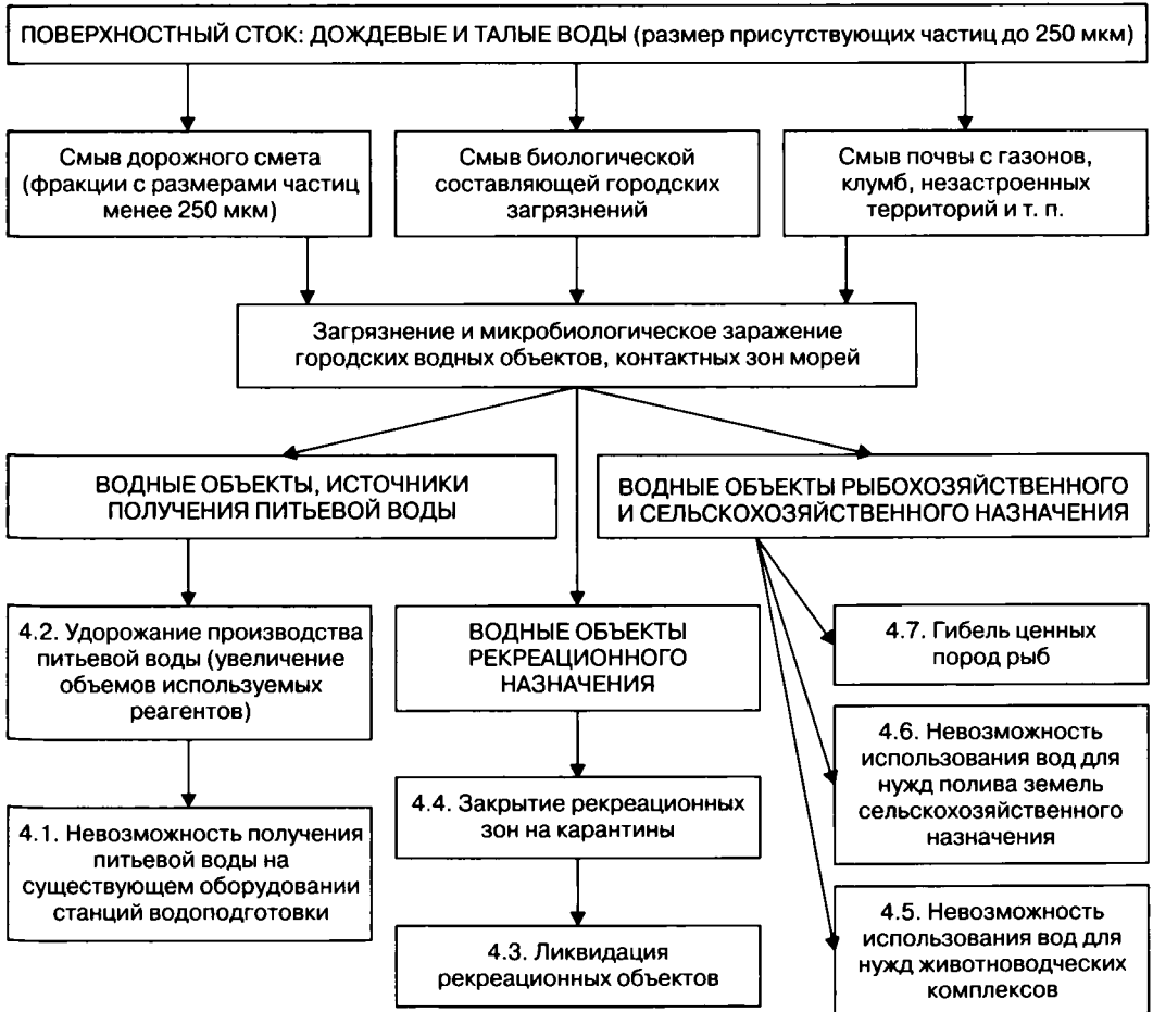
Рис. 4. Существующая ситуация и возможные последствия влияния поверхностного стока на химический и микробиологический состав вод рек, озер, контактных зон моря и т.п.

щую ситуацию. По данным Института коллоидной химии и химии воды НАН Украины (ИКХХВ НАНУ) загрязнение речных вод органикой, при высоких среднесуточных температурах (что является результатом климатических изменений), приводит к активному размножению микроорганизмов, прежде всего сине-зеленых водорослей. А это при хлорировании (обязательная процедура водоподготовки) делает питьевую воду опасной для жизни, так как образующиеся хлорорганические соединения являются высокотоксичными. Как отмечалось специалистами ИКХХВ НАНУ, объемы органических загрязнений из года в год возрастают, а их пики приходится на периоды после выпадения дождей, поэтому существующие станции водоподготовки