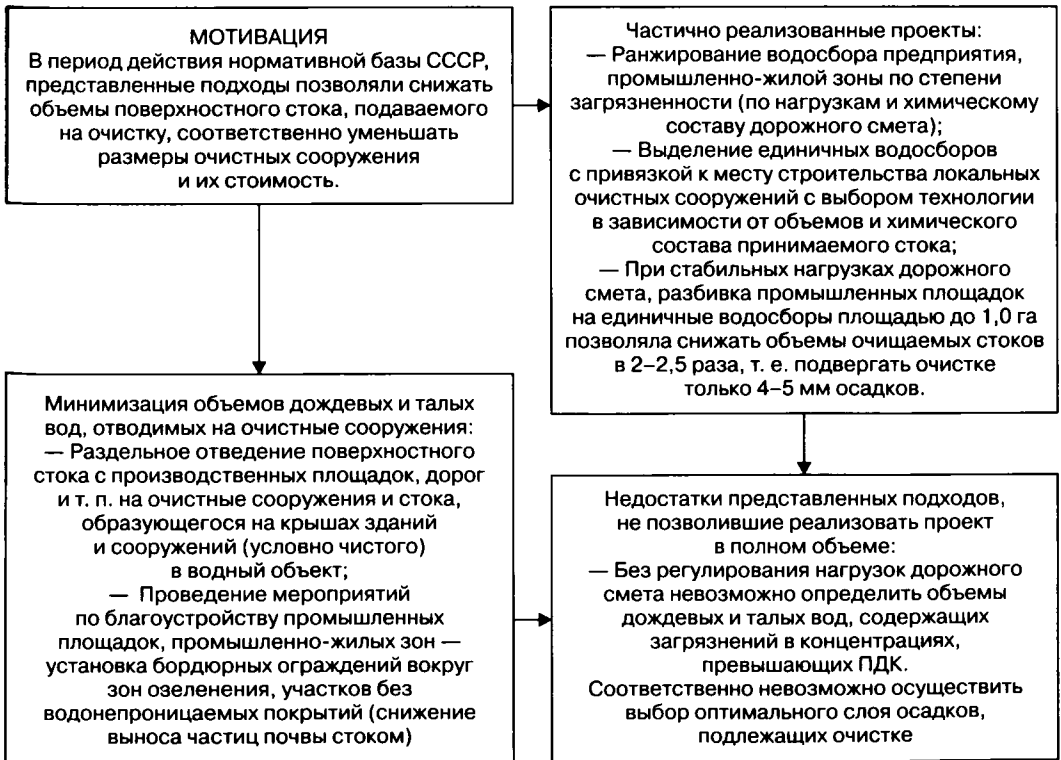
Рис. 7. Существующий опыт ВНИИ по охране вод (Харьков) по минимизации затрат при внедрении технологий отведения и очистки поверхностного стока

На рис. 7, в общих чертах, показаны технологические решения, позволявшие минимизировать объемы принимаемого на очистку поверхностного стока. Соответственно, снижались стоимость объектов и занимаемые ими площади. Представленный