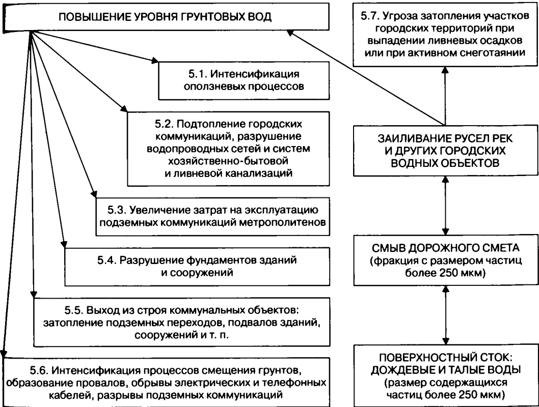
Рис. 5. Существующая ситуация и возможные последствия влияния поверхностного стока на заиливание городских водных объектов