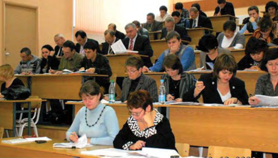
Эксперты отбирают лучшие образовательные программы

учебных заведений Российской Федерации. Субкластер «потребителей» регионального уровня состоит из членов территориальных Торгово-промышленных палат, региональных отделений Российского союза молодежи, Российского союза молодых ученых, территориальных объединений организаций профсоюзов, входящих в Федерацию независимых профсоюзов России, органов Федеральной службы по труду и занятости, министерств образования субъектов Российской Федерации [6].