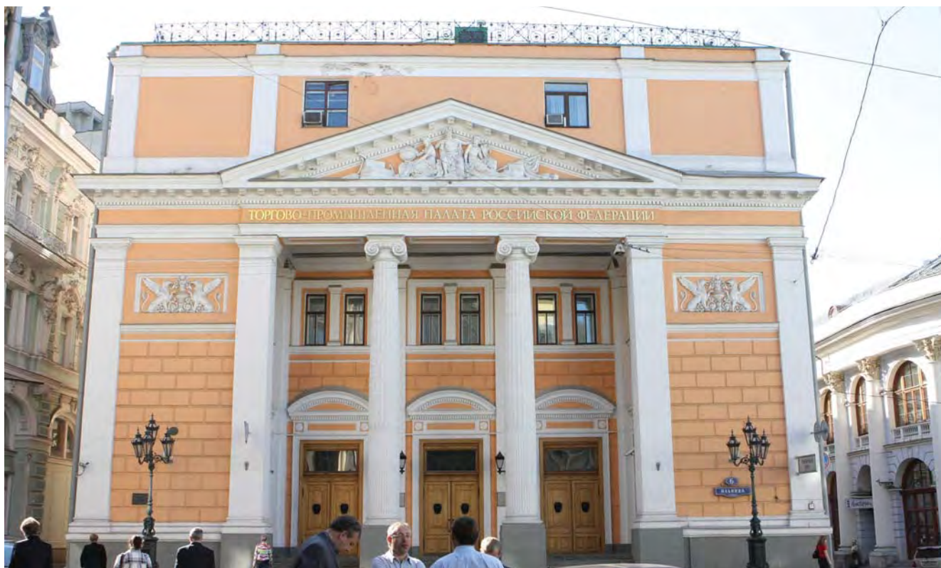
Торгово-промышленная палата Российской Федерации – ведущий федеральный стейкхолдер вузов России