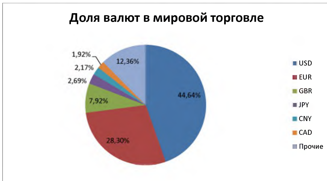
Рис. 1. Доля валют в мировой торговле, 2014 год

Проблема политики глобального неравенства приобретает все более острый характер. Так, главенствующая позиция доллара в системе международного валютного обмена, наглядно продемонстрированная на рисунке 1, и политика США, использующая мировое значение своей национальной валюты, являются примером устремлений одних экономических агентов устанавливать правила мирового развития.