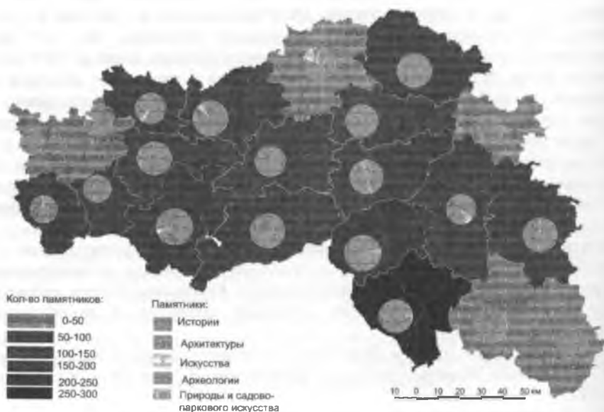
Рис. 3. Историко-культурный потенциал административных районов Белгородской области

«Высокую» качественную оценку» историко-культурного потенциала имеют Белгородский, Алексеевский, Волоконовский и Старооскольский административные районы. На территории Алексеевского и Волоконовский районов памятники располагаются достаточно равномерно, в Белгородском и Старооскольском объекты наследования тяготеют к административным центрам, т.е. к собственно городам Белгород и Старый Оскол.