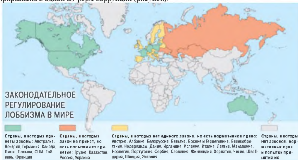
Рис. Законодательное регулирование лоббизма в мире

ках, тогда как в России лоббизм действует в условиях законодательного вакуума. Однако в существующей мировой правовой теории и практике нормативного регулирования отсутствует единообразное восприятие лоббизма или лоббистской деятельности. Специализированные законодательные акты, посвященные вопросам лоббизма, в масштабах земного шара кроме 60 американских и канадских федеральных и региональных законов, приняты в Польше, Литве, Грузии, Венгрии, Тоскане, Филиппинах, Перу и ряде других стран. Однако данная статистика не отражает постоянно возникающие в различных странах проекты законодательного оформления лоббистской деятельности, подобные проекты обсуждались в Бразилии, Казахстане и т.д. Италия в целом, в отличие от Тосканы не признает на законодательном уровне наличие лоббизма, во Франции лоббистская деятельность поставлена вне закона (ст. 23 и 79 регламента Национального собрания), а в Индии приравнена к одной из форм коррупции (рисунок).