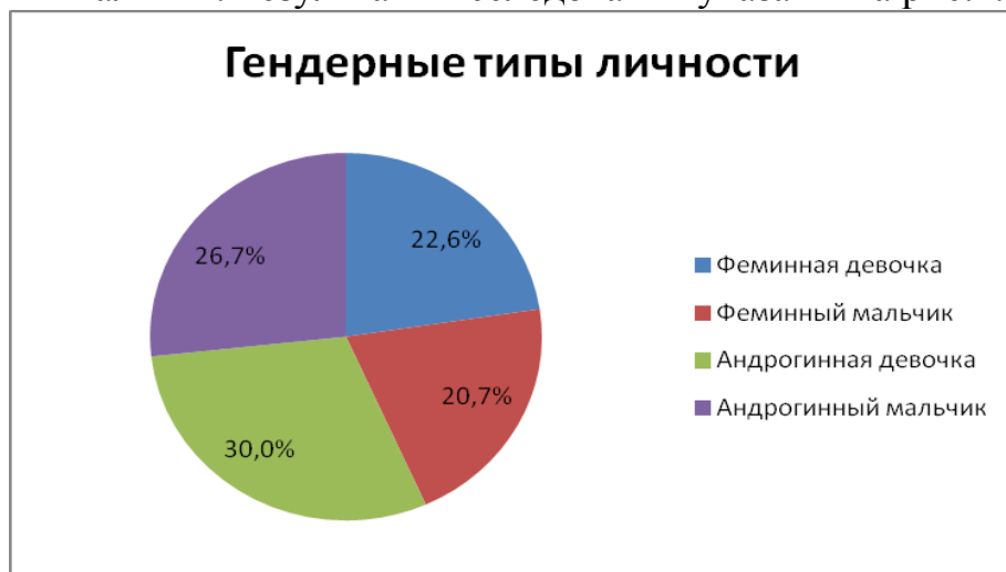
Рис.1. Гендерный тип личности

Анализ гендерного типа личности позволил выделить 4 группы испытуемых: феминная девочка, феминный мальчик, андрогинная девочка, андрогинный мальчик. Результаты исследования указаны на рис.1.